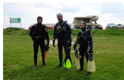
So war es im vergangenen Jahr !

Spenden für Kaffee und Kuchen sind herzlich willkommen!!! Bei schlechtem Wetter weichen wir auf eine Gaststätte aus. Welche, das wird kurzfristig über E.Mail bekanntgegeben. -----