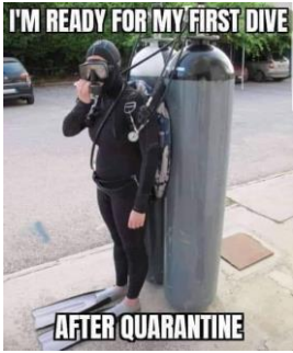
Geisetalsee vom 11.- 14. Juni 2020