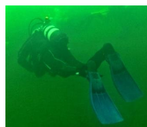
Atter See: vom 10.- 20.9.2020 in unterschiedlicher Besetzung!