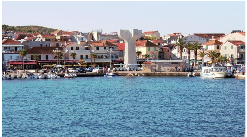
Landgang zum Eis-Essen!